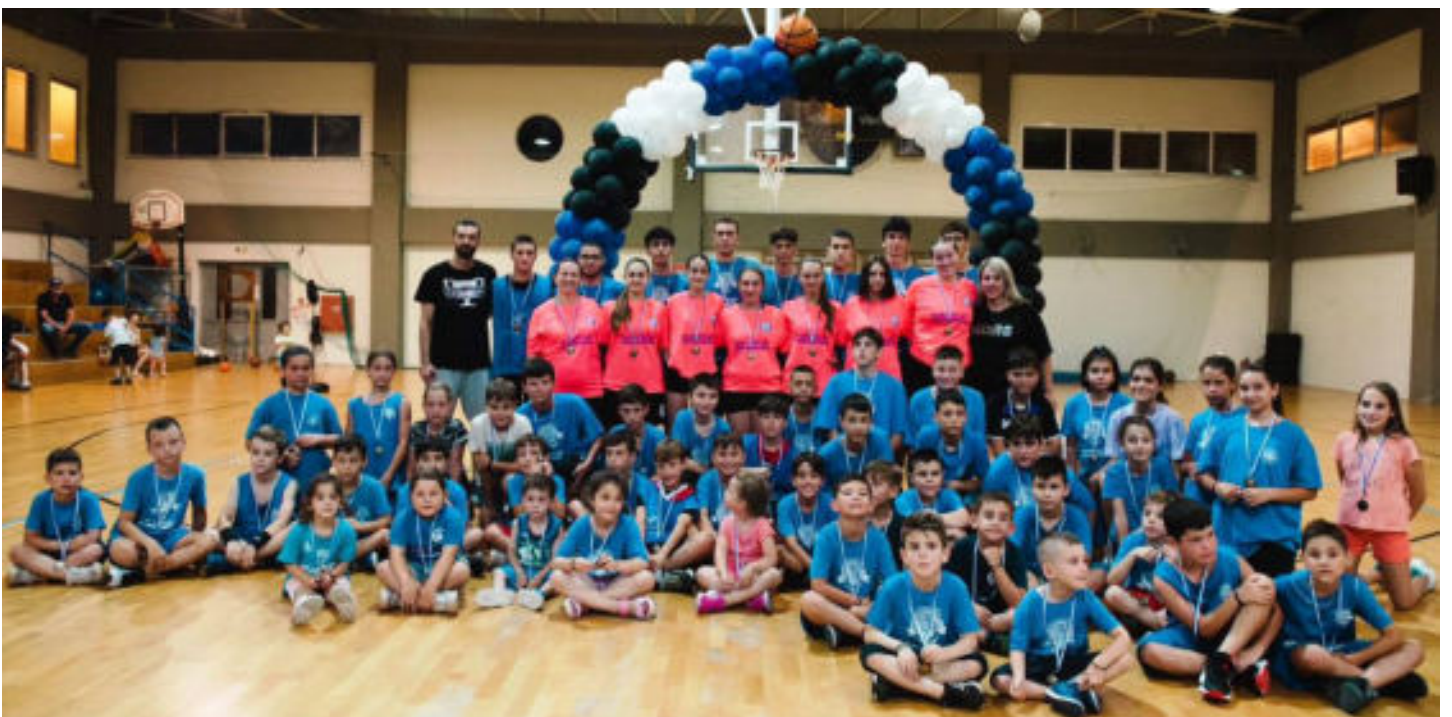
Τα τμήματα υποδομών του Αργοναύτη.

Ο Αργοναύτης έρχεται , μετά τις δυναμικές παρουσίες του Οίακα Ναυπλίου και της Ερμιονίδας τα τελευταία χρόνια, για να γίνει ένας νέος εκπρόσωπος της Αργολίδας . « Στόχος μας είναι για αρχή να καθιερωθούμε στη National League2 . Δεν είναι κάτι εύκολο, αλλά αυτός είναι ο στόχος μας, για να μπορέσουμε να δείξουμε σε περισσότερο κόσμο το τι υγεία έχουμε ως σύλλογο, δίνοντας έτσι το κίνητρο σε αθλητές και διοικητικά στελέχη με εμπειρία να μας επιλέξουν. Με το τρίπτυχο ομάδας, διοίκησης και του κόσμου που σταθερά μας στηρίζει σε αυτή την προσπάθεια, αλλά και της τεχνογνωσίας που προσφέρουμε από το τεχνικό επιτελείο, βοηθάμε όλοι να βγαίνει αυτή η υπέροχη αύρα, που βλέπετε στο γήπεδο », επισημαίνει ο τεχνικός του Αργοναύτη .