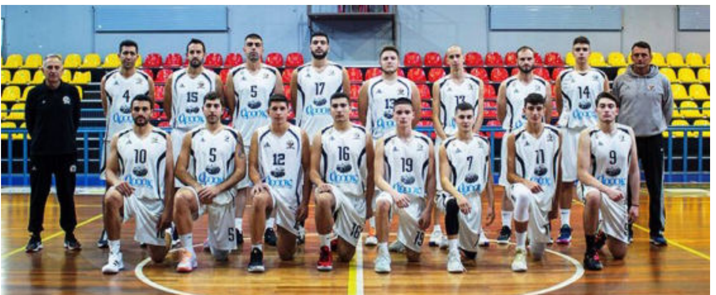
Η ομάδα αντρικού του ΑΣ Καστοριάς (2021).

Από το 2000 έως το 2004 αναλαμβάνει τα ηνία του γυναικείου τμήματος του Λασσάνη Κοζάνης στην Α2 εθνική κατηγορία πανηγυρίζοντας διαδοχικές παραμονές στην κατηγορία αλλά και ένα μετάλλιο στο πανελλήνιο κορασίδων . Την διετία 2004-2006 είναι προπονητής στην γυναικεία ομάδα του Απόλλων καλαμαριάς και ταυτόχρονα περιφερειακός προπονητής της ΕΚΑΣ Θεσσαλονίκης.