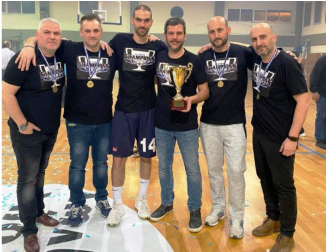
Η κατάκτηση του τίτλου της ΕΣΚΑΚ τη σεζόν 2022-2023.