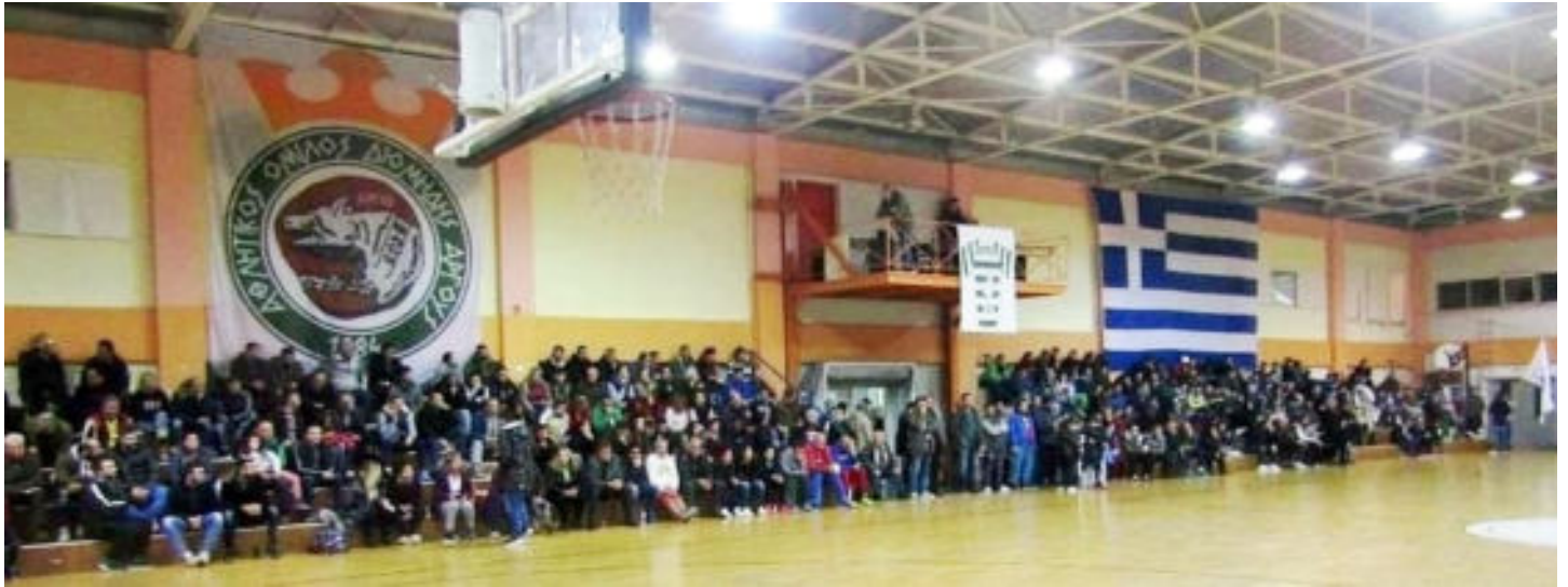
Το Κλειστό της Νέας Κίου και οι φίλαθλοι του Αργοναύτη.

Είναι κάτι πολύ διαφορετικό αυτό που συμβαίνει για εμάς και θέλουμε να δίνουμε πάντοτε το κίνητρο στους φίλους της ομάδας μας, που κάθε φορά αντιμετωπίζουν τους αγώνες μας ως ένα μεγάλο γεγονός της περιοχής», αναφέρει, ενώ δίνει την υπόσχεση πως «προπονούμαστε και προσπαθούμε καθημερινά, έχοντας ευτυχώς να ασχοληθούμε μόνο με το μπάσκετ, αφού υπάρχει και μια διοίκηση που μας διασφαλίζει αυτό το προνόμιο. Θα παλέψουμε να ανταποκριθούμε με όλες τις δυνάμεις μας σε αυτό το πρωτάθλημα».