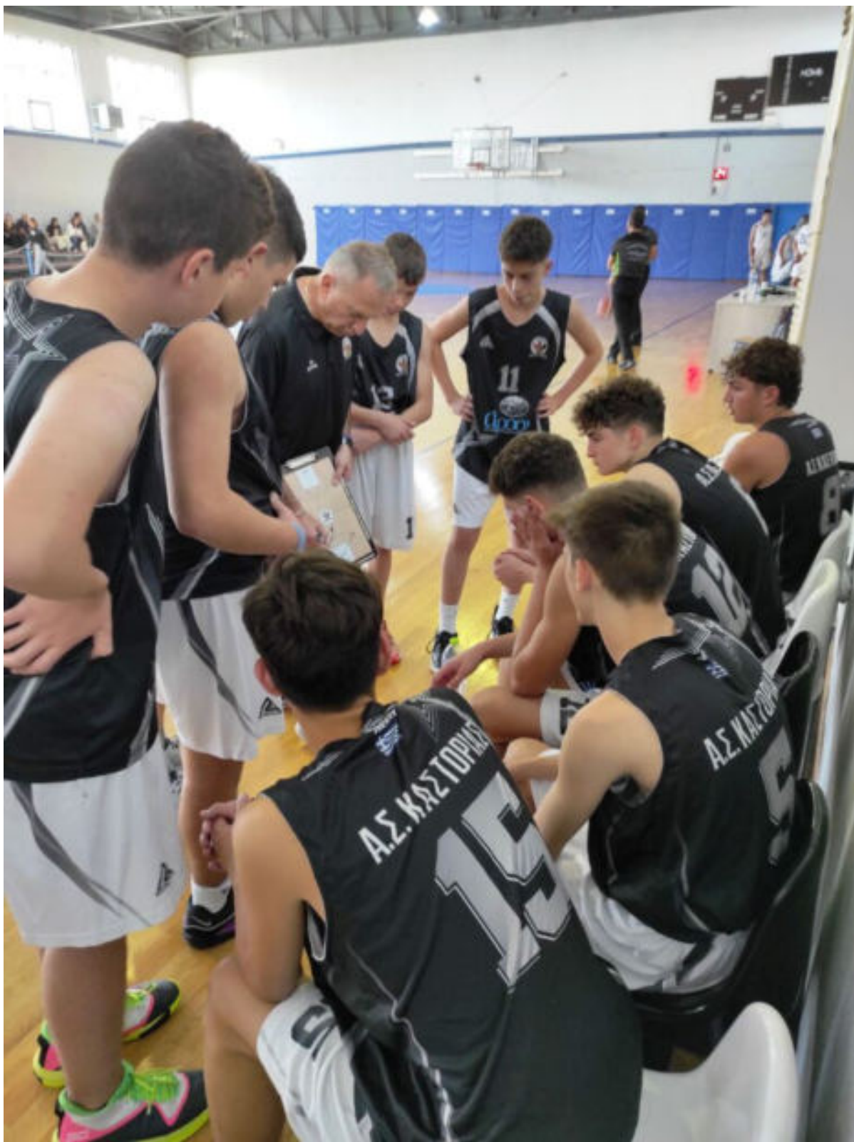
Με τη φετινή ομάδα Παίδων του ΑΣ Καστοριάς.