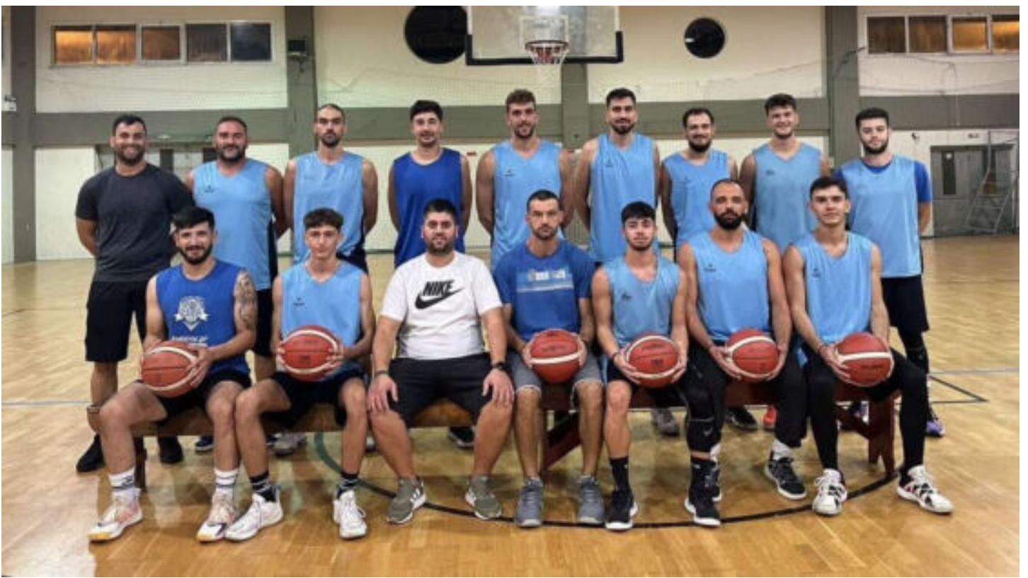
Η ομάδα του Αργοναύτη Νέας Κίου.

Ο Αργοναύτης έρχεται , μετά τις δυναμικές παρουσίες του Οίακα Ναυπλίου και της Ερμιονίδας τα τελευταία χρόνια, για να γίνει ένας νέος εκπρόσωπος της Αργολίδας . « Στόχος μας είναι για αρχή να καθιερωθούμε στη National League2 . Δεν είναι κάτι εύκολο, αλλά αυτός είναι ο στόχος μας, για να μπορέσουμε να δείξουμε σε περισσότερο κόσμο το τι υγεία έχουμε ως σύλλογο, δίνοντας έτσι το κίνητρο σε αθλητές και διοικητικά στελέχη με εμπειρία να μας επιλέξουν. Με το τρίπτυχο ομάδας, διοίκησης και του κόσμου που σταθερά μας στηρίζει σε αυτή την προσπάθεια, αλλά και της τεχνογνωσίας που προσφέρουμε από το τεχνικό επιτελείο, βοηθάμε όλοι να βγαίνει αυτή η υπέροχη αύρα, που βλέπετε στο γήπεδο », επισημαίνει ο τεχνικός του Αργοναύτη .