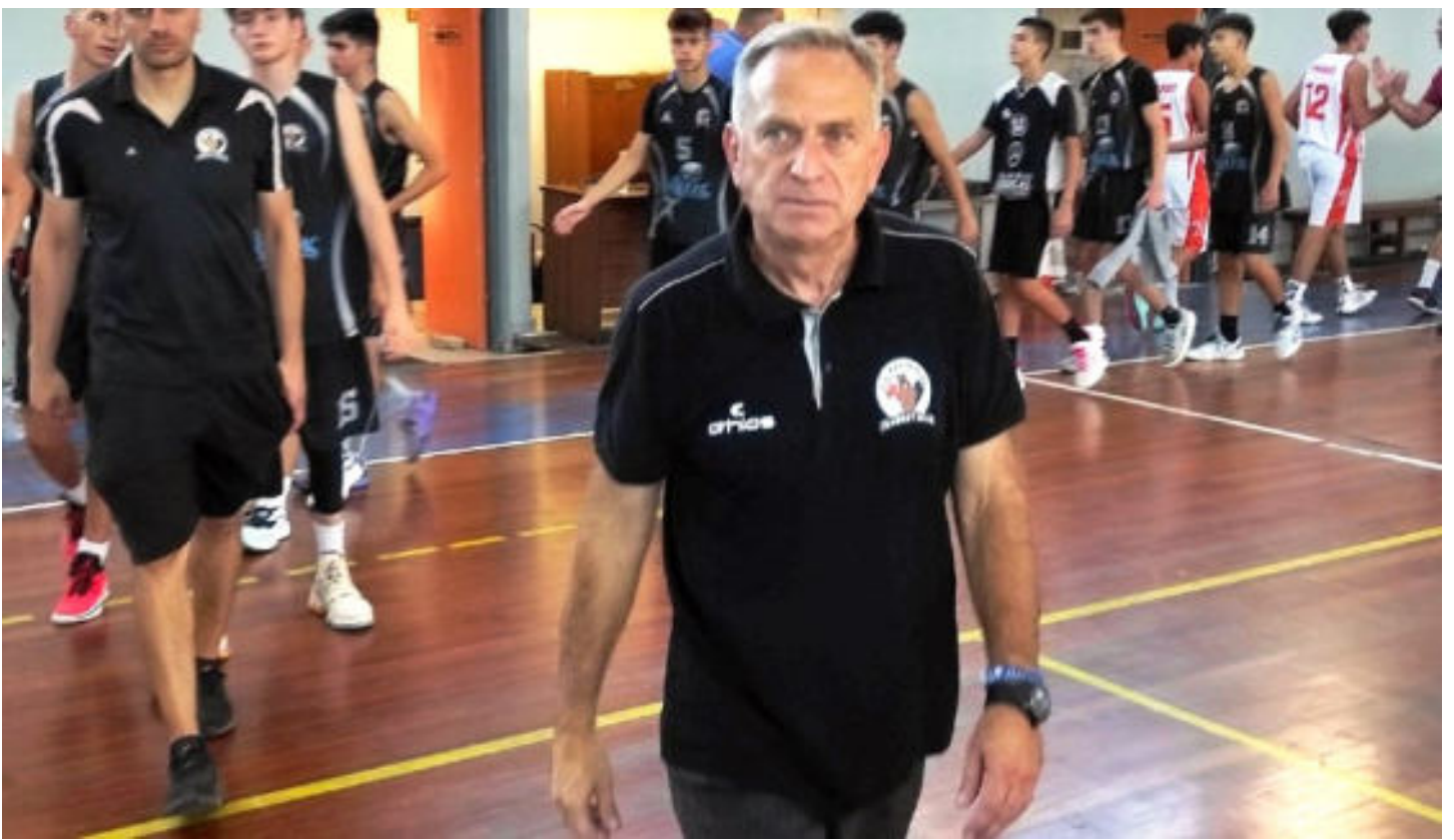
Σε αγώνα με την ομάδα ανδρών του ΑΣ Καστοριάς το 2019.

«Φαινόταν από μικρός στις ακαδημίες ότι είναι ταλέντο ξεχωριστό. Τότε η Καστοριά είχε δύο ομάδες τον Κάστωρ και τον ΓΟΚ και μαχόταν ποιος θα τον πάρει. Τελικά οι δύο ομάδες έκαναν συγχώνευση και το ευτύχημα είναι ότι δεν χάθηκε ένα από τα μεγαλύτερα ταλέντα/παίκτης στην Ελλάδα. Επίσης θυμάμαι ότι στην μικρή ομάδα της ΕΚΑΣΔΥΜ τον είχαμε καλέσει πρώτη φορά ο Δημήτρης Σιακαβάρης και εγώ που ήμασταν τότε προπονητές», θυμάται ο Γιώργος Καραταγλίδης.