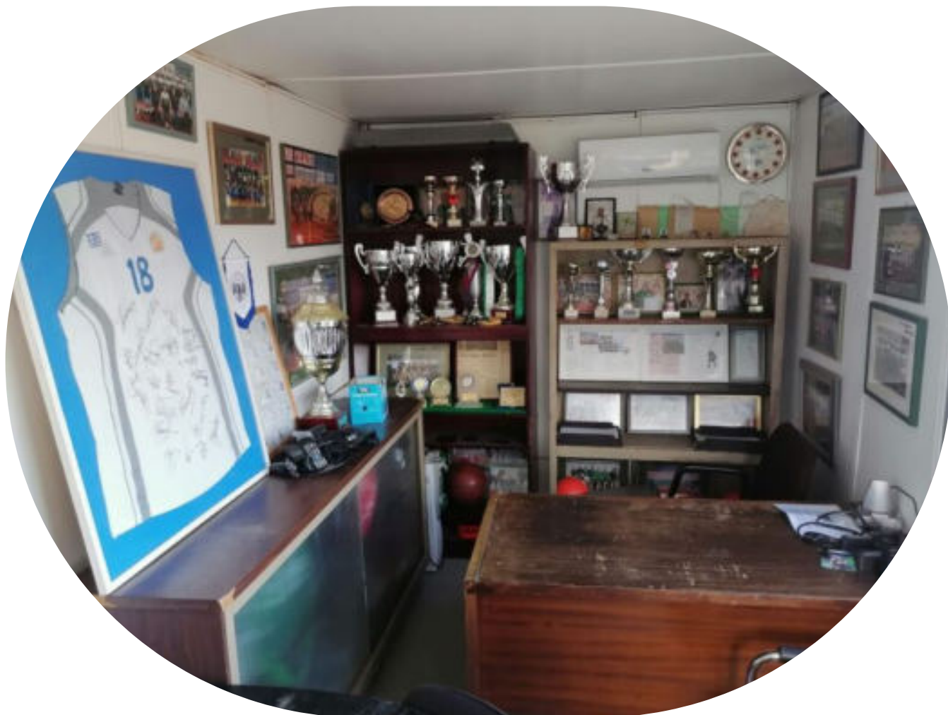
Όλη η ιστορία του Συλλόγου είναι σε αυτό το γραφείο.

που ναι μεν έχει μια βάση αλλά που ουσιαστικά είναι φρέσκο ως εγχείρημα. Οπότε κάπως έτσι βγήκε όλος ο συνδυασμός και ξεκλείδωσε αυτό που είχα στην σκέψη μου».