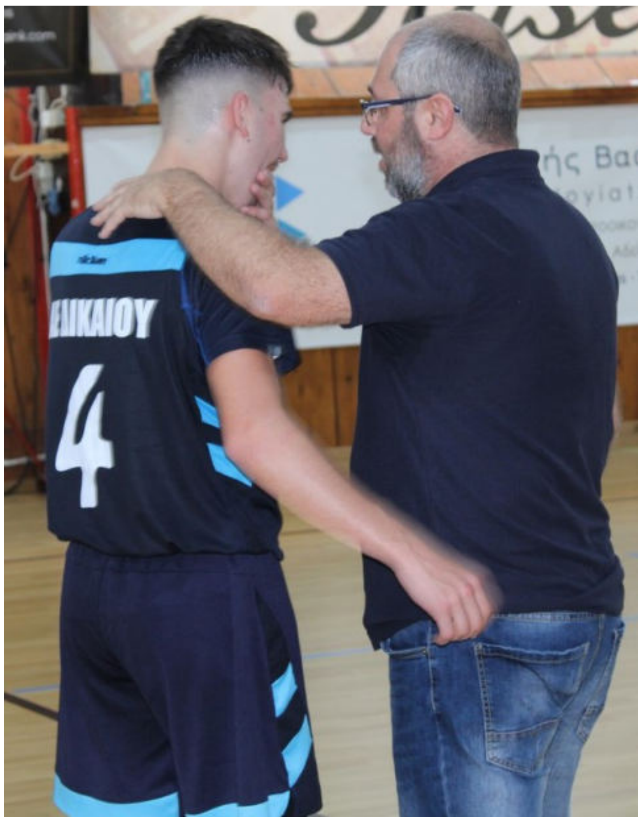
Αγκαλιασμένοι πανηγυρίζουν τον τίτλο στα Δωδεκάνησα.